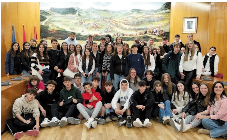
Photo des Espagnols et des Français à la mairie d'Almansa, avec la première adjointe PSOE, devant le tableau de 1709 fait sur demande du roi Felipe V pour représenter la fameuse bataille d'Almansa (1707) qui lui permit de consolider ses prétentions dans la guerre de Succession d'Espagne

Les interactions entre jeunes, dans les cours du lycée d'accueil, autour de matchs de foot, basket ou hand, et enfin dans le cadre des commémorations locales ont contribué à une immersion complète en espagnol. L'accueil réservé par les familles espagnoles a été tel que les larmes versées au moment du départ ont été nombreuses. C'était un bel échange, culturel, linguistique et surtout humain.