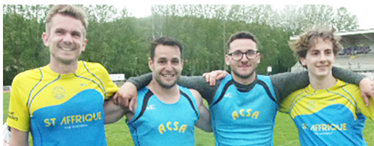
Le relais 4x100 m masculin de l'ACSA vaudra améliorer son chrono de 50"54