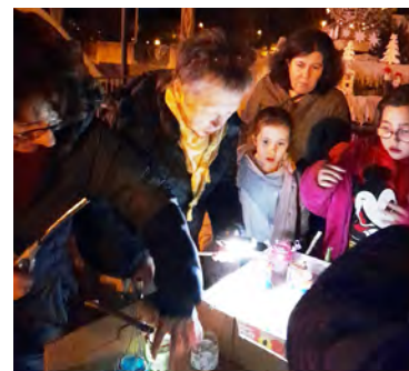
L'allumage des lampions avant le départ sur la place de la mairie.