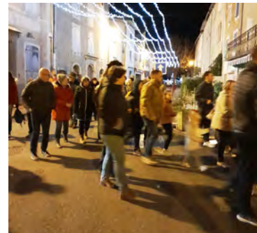
Le défilé dans le village.