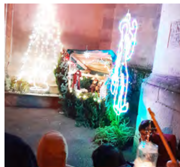
En chantant devant les illuminations du village