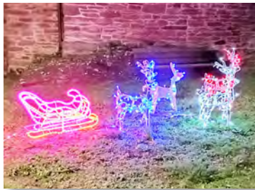
Combret en lumières

L'église et sa crèche ont été également préparées pour le bonheur des petits et grands ! Ouverture à partir du vendredi 22 décembre et jusqu'au dimanche 7 janvier tous les après-midis de 14 h à 17 h.