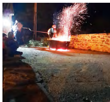
Retour sur la place du village pour la grillée des châtaignes