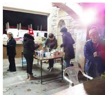
Les bénévoles distribuent cornets de châtaignes, roses des sables, boissons et vin chaud.

L'Association remercie les enfants, leurs parents ainsi que les deux écoles et l'AFR pour leur participation et tous les bénévoles ayant contribué au succès de cette belle soirée pour leur aide. Les membres de l'association se retrouveront en début d'année pour les préparatifs du cru 2024 du RDV Jardinier.