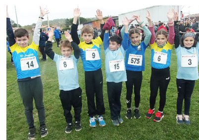
Les poussins voudront briller à Millau

Après leur bonne prestation samedi 18 novembre à La Primaube lors de la 1ère journée du Challenge Cross Country du Conseil Départemental, les jeunes de l'Athlétic Club Saint-Affricain vont se déplacer ce prochain samedi 2 décembre à Millau pour participer à la 2ème journée du challenge cross country du Conseil Départemental qui se déroulera sur les espaces de La Maladrerie. L'ouverture du secrétariat est prévue à partir de 12h30 pour le retrait des dossards, pas moins de 4 courses sont au programme avec des regroupements de catégories. A partir de 14 heures une animation intitulée parcours kid est réservée aux plus jeunes des catégories éveillé athlétique garçons et filles.