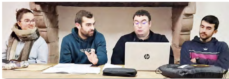
Une partie des membres du bureau