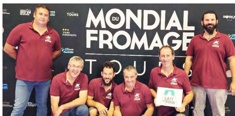
Une médaille d'or dans de bonnes mains

Bravo à tous les acteurs de cette belle réussite !