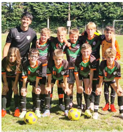
Belle journée pour les U13 en terre Lozérienne !

Pour la quatrième journée de championnat, nos U13 sont partis pour la journée en Lozère. Départ matinal pour passer un moment convivial et pouvoir manger avant les rencontres au Lac du Moulinet non loin du stade. Arrivés à midi sur le stade, nos U13 étaient en forme et déterminés pour affronter Mende 1 et Millau 1.