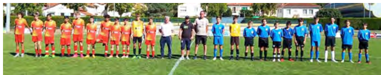
Lourde défaite pour l'entente SSA/JSRR !

Week-end prochain, déplacement à Espoir Foot 88, une équipe qui joue également le haut de tableau.