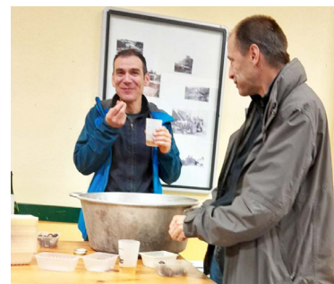
Président et trésorier dégustent les châtaignes