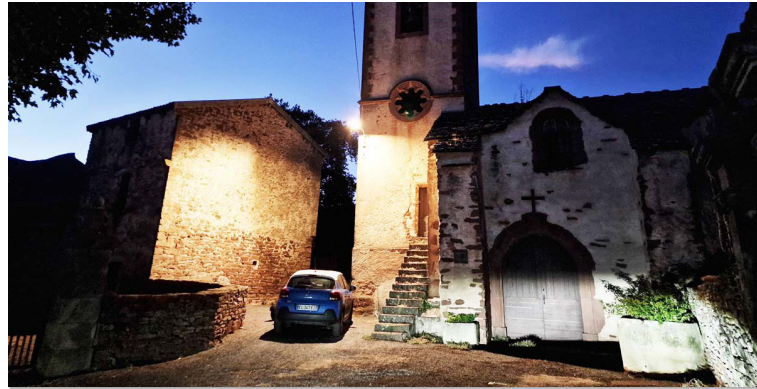
L'église du hameau de Bétirac et son nouvel éclairage

De plus, ce type de luminaires permet un éclairage performant et ils limitent la pollution lumineuse nocturne. Avec un éclairage optimisé vers le bas et non vers le haut, on constate une diminution de l'impact environnemental. Le coût de cette tranche est de 10.443 € HT financé en partie par le SIEDA (Syndicat d'Energies de l'Aveyron) et par l'Etat dans le cadre des subventions au titre du fond vert.