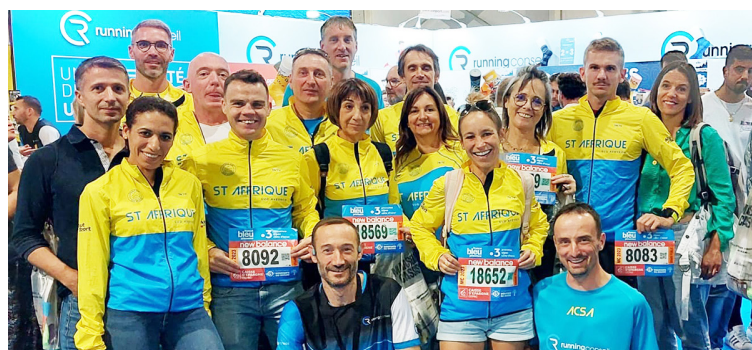
Les coureurs de l'ACSA présents en nombre et en force

Pas moins de 17 sociétaires de l'Athlétic Club Saint-Affricain ont participé à cette magnifique course qui s'est déroulée dans une superbe ambiance.