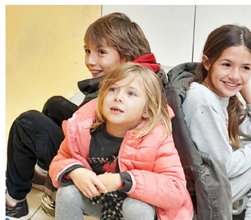
Les enfants couvent les châtaignes