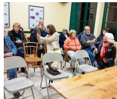
Une partie de l'assemblée