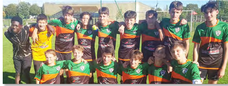
Belle victoire pour les jeunes U15 du SSA/JSRR !

Week-end prochain, réception de Millau à 15 h à domicile au Stade Municipal de St-Affrique. Venez nombreux les encourager !