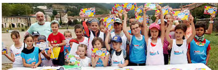
35 jeunes présents pour l'opération Kinder