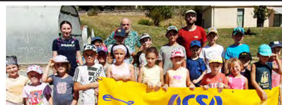
Le groupe des plus jeunes (éveil athlétique et poussin(es))

Les enfants sont invités à venir nombreux avec leurs copains et copines pour participer gratuitement à cette animation ouverte à tous les