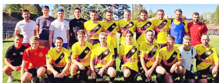
Une belle équipe de Rance et Rougier avec les dirigeants des 3 équipes seniors !

Le week-end prochain, les trois équipes sont sur le pont : dès le vendredi 21 h la 3 reçoit Salles Curan, le samedi place à l'équipe première qui essaiera de réaliser l'exploit en se qualifiant pour le 4ème tour de Coupe de France à Camarès à 17 h, enfin la 2 ira en terre lozérienne défier Chanac. On vous attend nombreux aux bords des terrains !