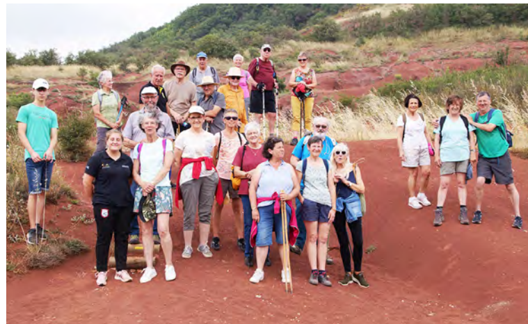
Le groupe dans les montagnettes