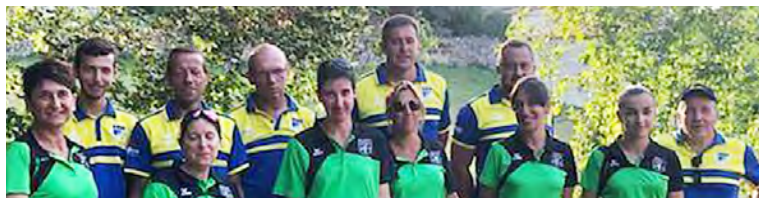
L'équipe d'EPSA 2 et St-Sernin sur Rance

A Ouyre, l'équipe d'EPSA 2, en division 4 a largement dominé l'équipe de St-Sernin sur Rance en gagnant la rencontre 24 à 12.