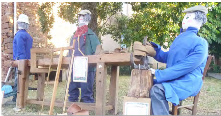
Poupettes : le maçon, le menuisier et le cordonnier

De nombreuses personnes ont parcouru les ruelles de Rebourguil à la rencontre "des poupettes" du 15 juillet au 15 août. Ce fut un agréable moment pour tous. Les personnes les plus âgées ont pu faire un retour dans le passé et les plus jeunes imaginer ce qu'était la vie de leurs aïeux. Merci à tous ceux qui par leur présence ont fait vivre cette exposition.