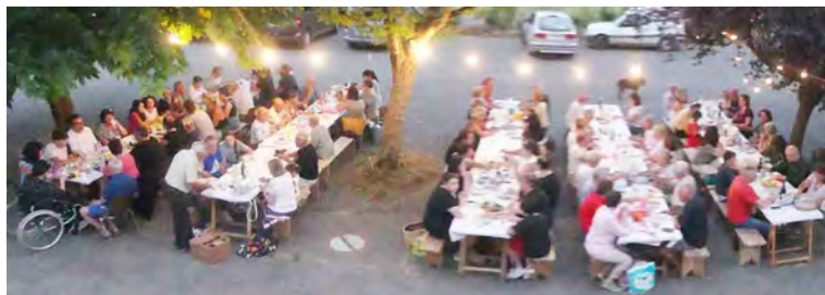
Une rencontre conviviale