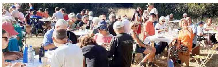
Copieux petit déjeuner sur le Causse

Si chacun a pu passer une matinée mémorable, il faut souligner le gros travail logistique des membres du Club des Aînés-Générations Mouvement.