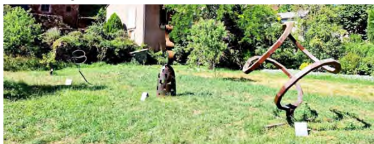
3 des nombreuses œuvres exposées à Combret

Cette exposition estivale temporaire a été organisée par l'association Combret Animations Patrimoine grâce à la générosité des artistes et de l'atelier 12 Figures à St-Sernin.