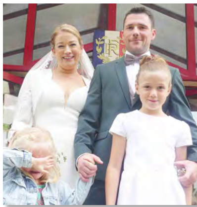
A la sortie de la mairie