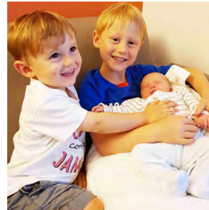
Deux frères déjà très attentionnés