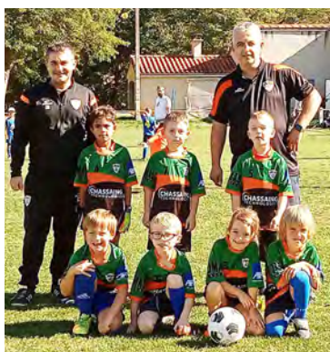
Le sourire des U7 pour le dernier match de la saison avec les deux éducateurs