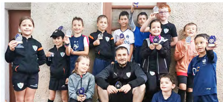
Une belle fin de saison pour les U9 accompagnés de leur éducateur