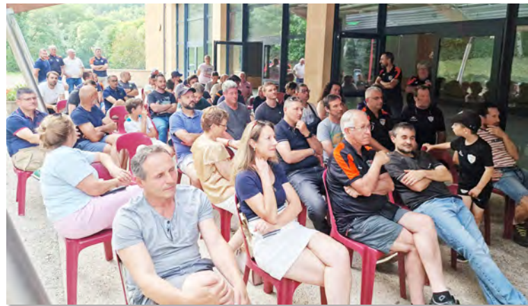
Une belle AG qui a réuni les footballeurs de Rance et Rougier

L'ensemble du bureau de la JSRR vous souhaite à tous de bonnes vacances et nous espérons vous rencontrer très vite au bord des stades.