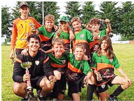
Une belle journée pour les jeunes U13 qui ramènent la coupe à la maison

Nos U13, ce dimanche 18 juin sont partis affronter 14 équipes au tournoi de Rieupeyroux. Effectif de onze U13 et renforcé de cinq U11, nous avons réalisé deux équipes équitables. Le principe du tournoi étant match de poule le matin puis accès à la Ligue des Champions pour les deux meilleurs de chaque poule et accès à l'Europa Ligue pour les deux suivants.