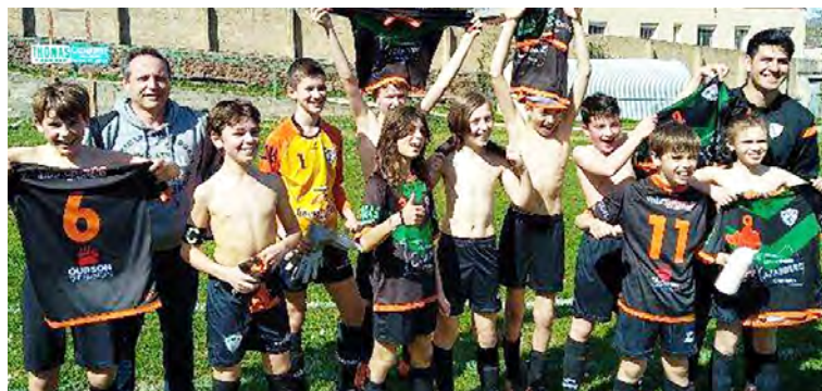
Beau week-end pour les U13 sous le soleil de Camarès !