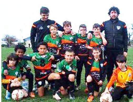
Les U11 motivés pour ce week-end !

Après une première journée difficile contre les deux plus grosses équipes de la poule, samedi à Réquista, nos U11 ont retrouvé le goût de la victoire contre Réquista 1 (5-4). Pour le second match, malgré des occasions franches de buts, l'équipe de Luc Primaube 2 s'est montrée plus réaliste et solide.