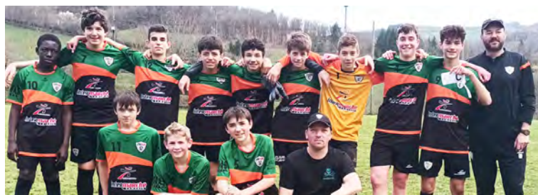
Belle victoire pour les U15 de Rance et Rougier !

Rdv le week-end prochain avec la réception de Foot Vallon, une équipe du haut du tableau.