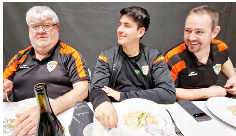
Les bénévoles de Rance et Rougier mis à l'honneur par le District Aveyron Football !

Merci au District Aveyron Football pour l'organisation de cette soirée, et pour la reconnaissance de l'ensemble des acteurs impliqués tous les jours pour faire vivre le football amateur.