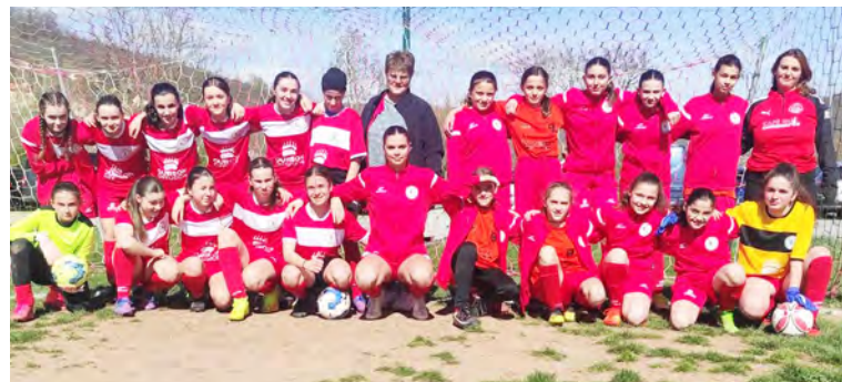
Des progrès encourageants pour les filles de l'entente féminine de JSRR/AS VABRES/SSA !

La prochaine journée les filles se déplaceront au Bleyard (en Lozère) et à Villefranche de Rouergue.